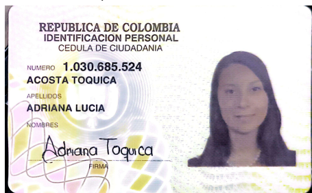
Cédula (Cara Delantera):