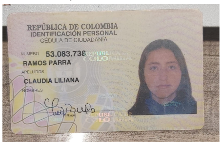
Cédula (Cara Delantera):