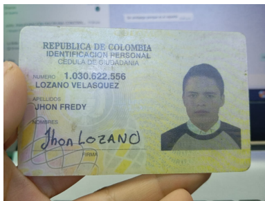
Cédula (Cara Delantera):